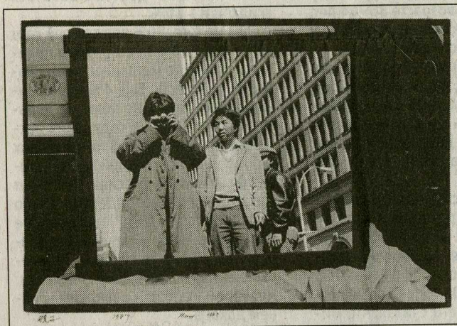
На выставке представлена фотосерия, связанная с пребыванием Ай Вэйвэя в Нью-Йорке в начале 1980-х годов.

Именно об этом и снимки Ай Вэйвэя, попавшего в Америку по артистическому гранту в начале 1980-х (хотя реальная причина для полета в Нью-Йорк – погоня за возлюбленной). И вот тут вместе со свежим эмигрантом мы начинаем погружаться в лабиринты мегаполиса. Это погружение отличают две особенности, связанные с происхождением проводника: во-первых, основной круг его тусовки – это тоже китайцы. Само собой, выпускник пекинской киношколы общается с тем, с кем не возникает проблем коммуникации. Он сидит в барах, где сидят китайцы, ходит по подвалам, где у китайцев мастерские и клубы, следует за группой, снимающей документальный фильм «Пекинцы в Нью-Йорке» (1992). Иными словами, мы словно бы оказываемся в центре артистического Чайна-тауна – примерно так же какой-нибудь русский ресторанный шансонье водил бы нас по Брайтон-бич. Впрочем, Вэйвэю удалось сойтись с Алленом Гинз-